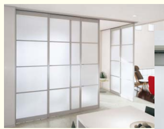
スクリーンウォール

下レールがないスクリーンウォールで床面スッキリ。 ゆっくり閉まるソフトクローズ機構で指づめの心配も低減。