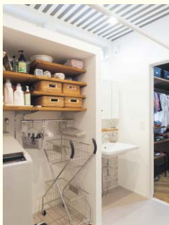
室内物干しユニット ホシ姫サマ