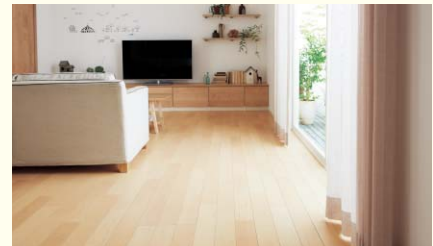
温水床暖房 You温すい

足元からポカポカとあたたかい床暖房。 燃焼によるCO 2 や風、音、 においがありません。