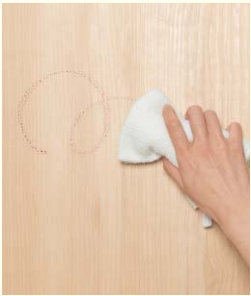
油性ペンの汚れも染み込みにくく、サッと落とせます。※1

建具の表面に、汚れを寄せ付けない硬化コーティングを施してあるので、汚れてもさっと拭き取るだけ。また、キズへの強さもあわせて実現しています。