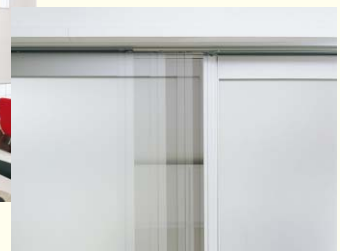
ソフトクローズ (間仕切り開閉壁など)