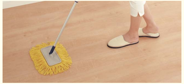
※真銘木フローリング [145mm幅]、ラビスタイルフローアー [3尺長] は除く。

お手入れが必要な床もパナソニックならワックスがけなし。汚れても拭くだけなので、お掃除の手間も軽減。キズにも強く、住まいの美しさが保たれます。