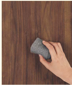
スチールウールでこすってもほとんど傷つきません。

※1 台所用中性洗剤を含ませた布で拭きとり、最後にしっかりと乾いた布で薬剤成分を表面に残さないようきれいに拭き取るようにしてください。また、汚れがしみこみにくく、サッと落としやすい処理を施しているため、塗料の上塗りはできません。補修などの作業にはご注意ください。